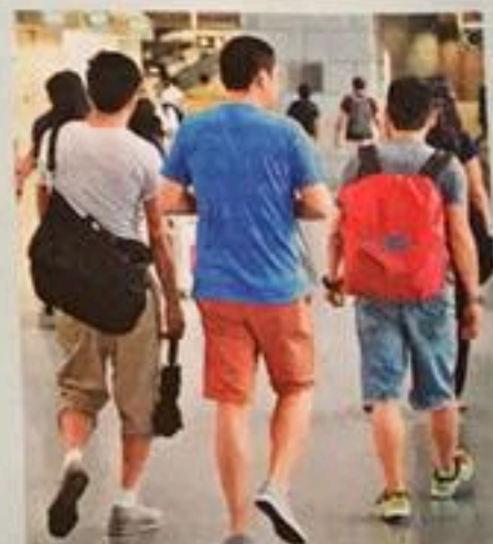
計劃首次就青少年精神健康調查，望從中了解問題根源。

另外，去年2月推出，針對患認知障礙症長者的「智友醫社同行計劃」，現時先導計劃有21間長者地區中心約1300人參與，計劃明年常規化，並擴展至41間中心，提供4000個名額，計劃提供5至9個月訓練，以改善患者的認知能力，提升家居安全知識、自理能力、身體機能 and 社交技巧等。