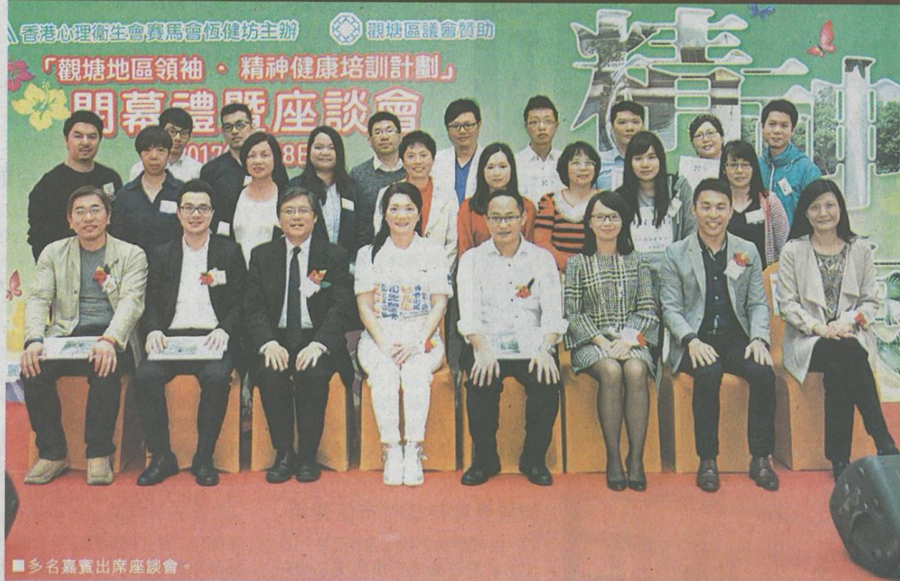
■多名嘉賓出席座談會。

「觀塘地區領袖·精神健康培訓計劃」於2016年10月至11月期間，已完成一系列的重點培訓及活動，包括成功舉行兩班精神健康急救課程，共培訓超過38位觀塘地區領袖，舉辦社區探訪活動，讓多位地區領袖參觀精神健康綜合社區中心賽馬會恆健坊，並與康復者進行深入的對話交流，了解精神復康服務的需要及發展。深信能